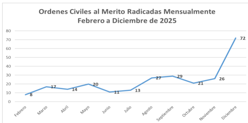
Gráfico No. 2. Postulaciones mensualmente recibidas en secretaria General

Así mismo, en el Grafico 2., se puede visualizar la cantidad de postulaciones que se recibieron y radicaron mensual en la Secretaria General del Organismo de Control, las cuales fueron puestas a consideración del Comité de Acreditación para otorgar la Orden Civil al Mérito José Acevedo y Gómez: